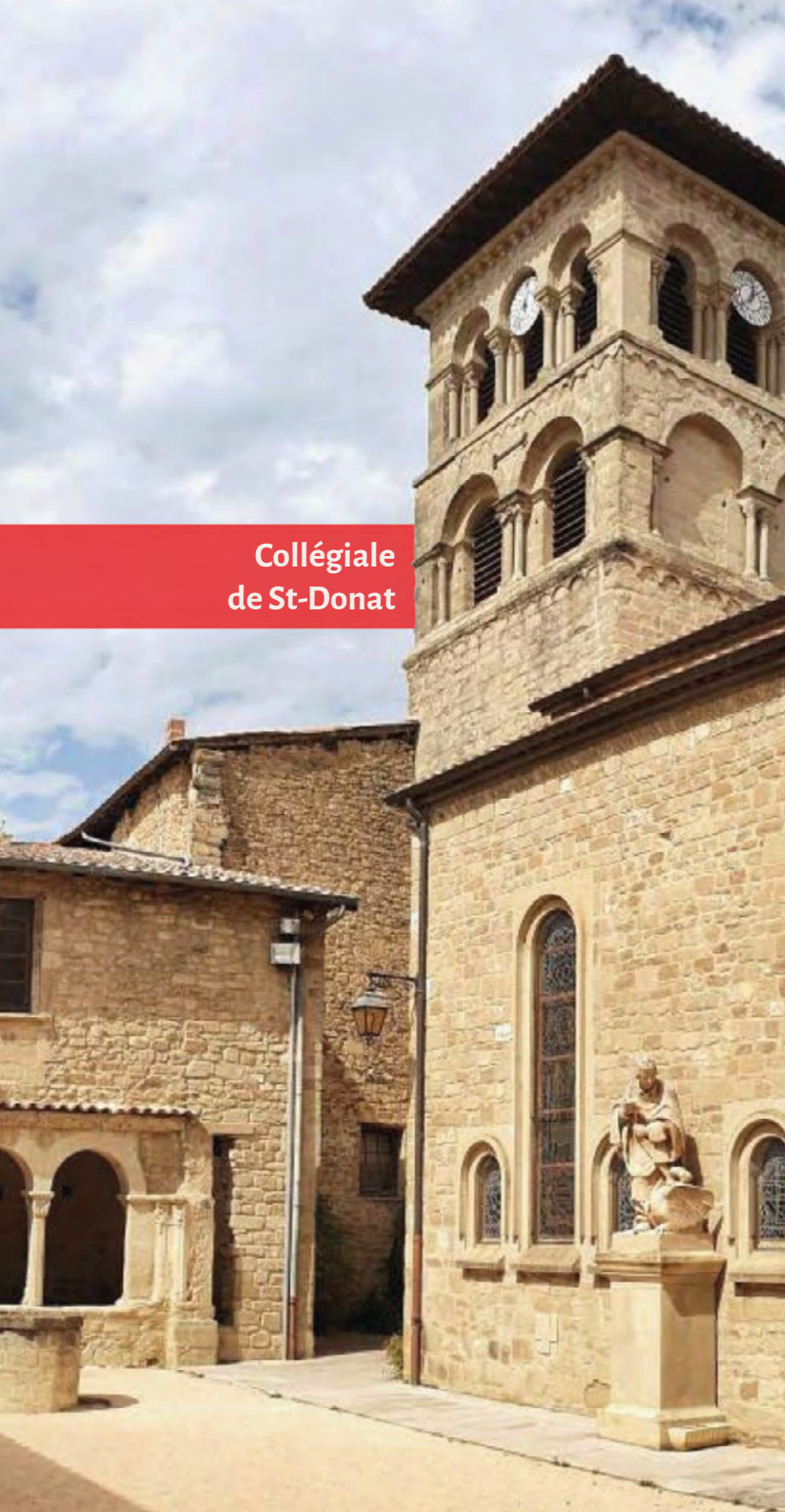
Collégiale de St-Donat