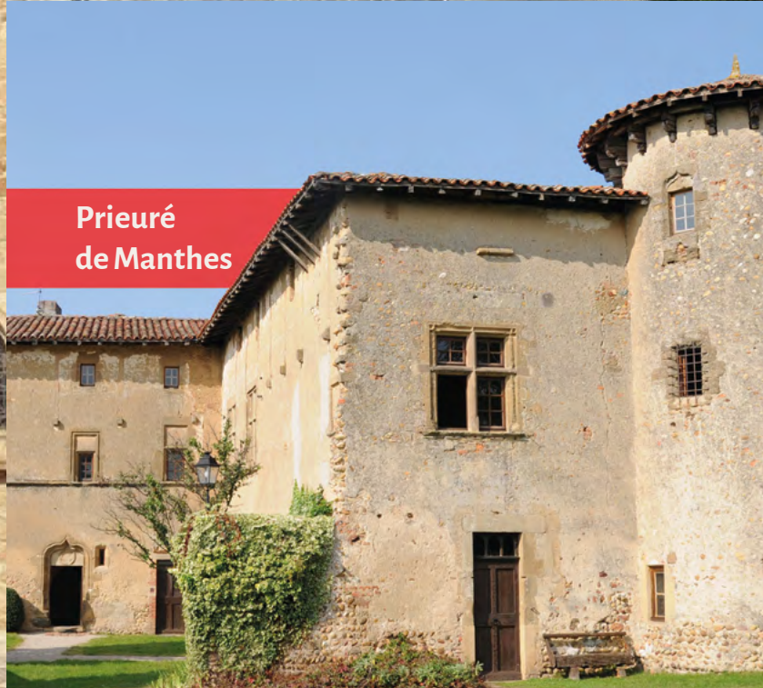
Prieuré de Manthes