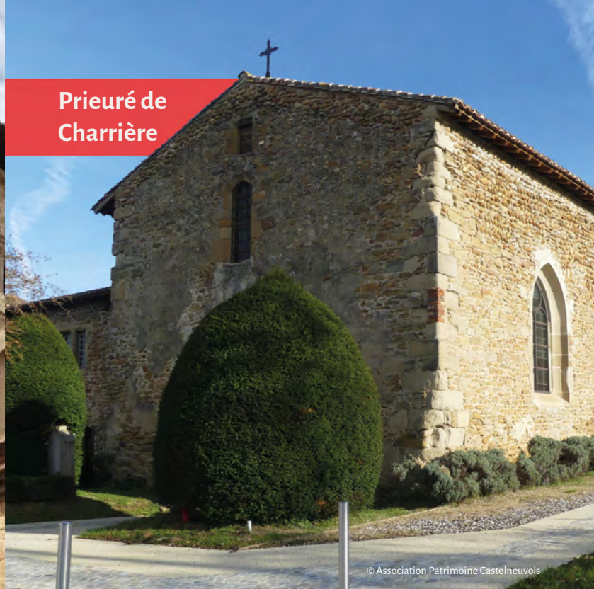
Prieuré de Charrière